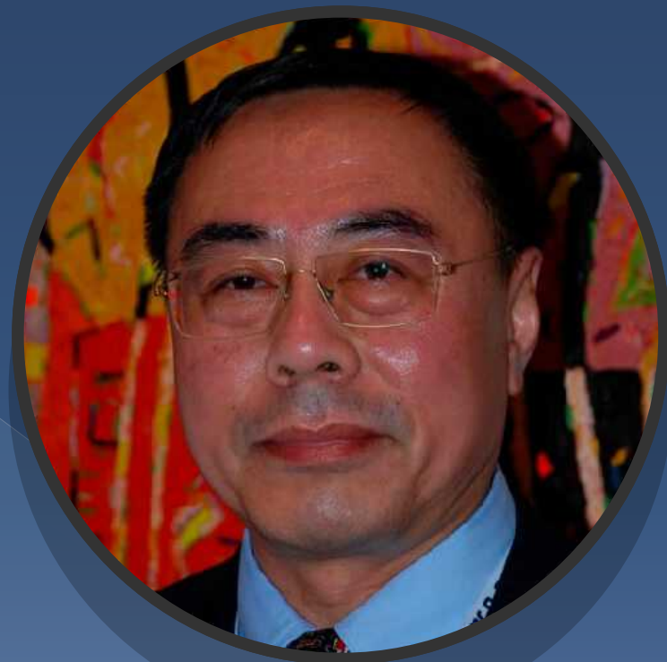
Создатель электронной сигареты китайский ученый – фармацевт Хон Лик

Слово английского происхождения «vape» не имеет строгой трактовки, поскольку является производным от «vapour», что означает пар. Наиболее известный перевод звучит как: это процесс вдыхания и выдыхания пара, производимого электронной сигаретой или схожим устройством.